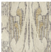
4032-03 SCULPTURE - GALET