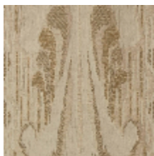
4032-01 SCULPTURE - NATUREL