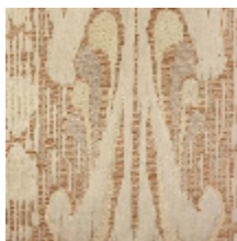
4032-02 SCULPTURE - ROUX