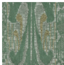
4032-04 SCULPTURE - CELADON