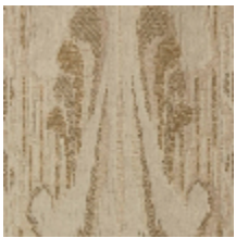
4032-01 SCULPTURE - NATUREL