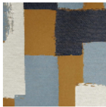
4033-03 ABSTRACT - OR BLEU