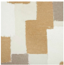
4033-01 ABSTRACT - BLANC SABLE