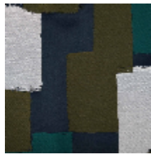
4033-04 ABSTRACT - VERT MARINE