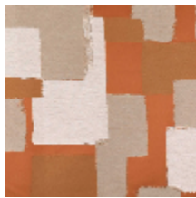
4033-02 ABSTRACT - TERRA NATUREL