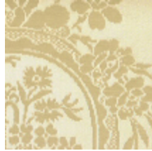
4048-23 RAMBOUILLET - ECUME