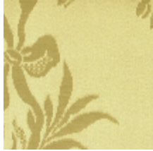
4048-02 RAMBOUILLET - PAILLE