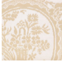
4048-22 RAMBOUILLET - IVOIRE