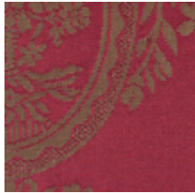
4048-32 RAMBOUILLET - ROUGE/BIS *