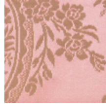
4048-24 RAMBOUILLET - ROSE OLIVE