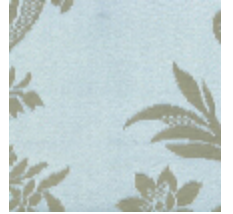
4048-27 RAMBOUILLET - NATTIER BIS