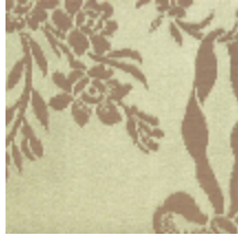
4048-21 RAMBOUILLET - VERT/BIS