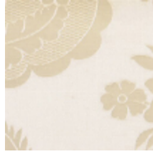
4072-08 DAMAS VALENCAY- NACRE *