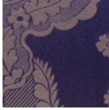
4072-02 DAMAS VALENCAY-NUIT *