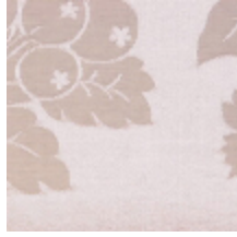
4072-07 DAMAS VALENCAY- EGLANTINE *