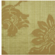
4083-06 ELOISE- CHARTREUSE *