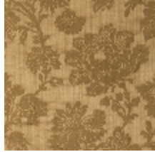
4083-04 ELOISE-MARRON GLACE