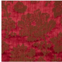
4083-10 ELOISE- RUBICOND