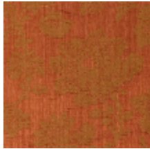
4083-09 ELOISE- CORNALINE