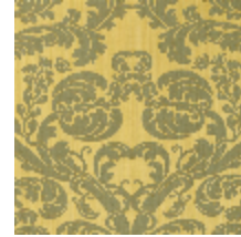
4128-05 DAMAS TOURNELLE - OR/BLEU