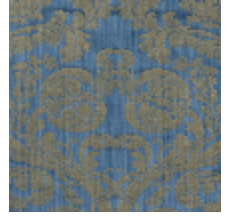
4128-06 DAMAS TOURNELLE - ROY