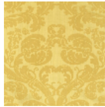
4128-04 DAMAS TOURNELLE - OR