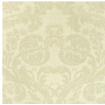
4128-01 DAMAS TOURNELLE - COQUILLE