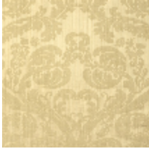
4128-02 DAMAS TOURNELLE - BEIGE