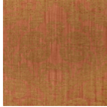
4128-03 DAMAS TOURNELLE - CUIVRE