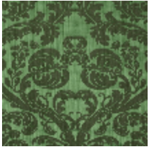
4128-07 DAMAS TOURNELLE - EMERAUDE