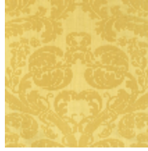
4128-04 DAMAS TOURNELLE - OR