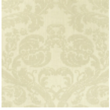
4128-01 DAMAS TOURNELLE - COQUILLE