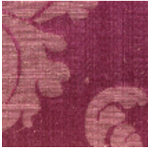
4128-08 DAMAS TOURNELLE - FRAMBOISE