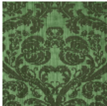
4128-07 DAMAS TOURNELLE - EMERAUDE