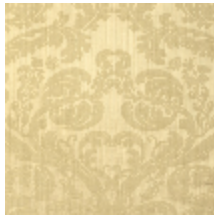
4128-02 DAMAS TOURNELLE - BEIGE