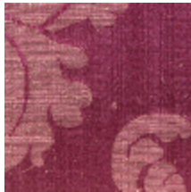
4128-08 DAMAS TOURNELLE - FRAMBOISE