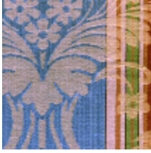
4139-02 LOURMARIN- NATTIER/VIEIL OR