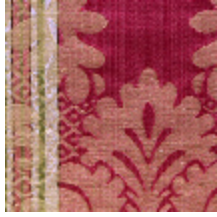
4139-01 LOURMARIN- BORDEAUX/VIEIL OR