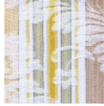
4139-05 LOURMARIN- BEIGE/COQUILLE