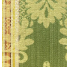
4139-03 LOURMARIN- MOUSSE/TOMETTE