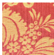
4140-07 GRAMBOIS - TOMETTE *