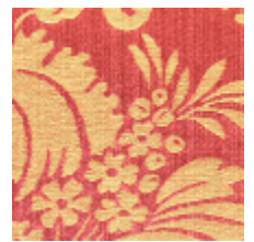
4140-07 GRAMBOIS - TOMETTE