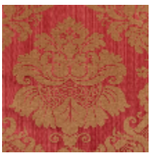
4140-01 GRAMBOIS - BORDEAUX