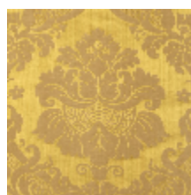
4140-06 GRAMBOIS - VIEIL OR