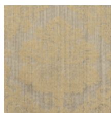
4140-04 GRAMBOIS - ARGENT *