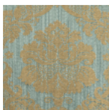
4140-02 GRAMBOIS - NATTIER