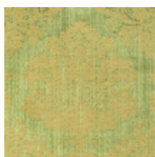
4140-03 GRAMBOIS - MOUSSE