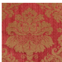
4140-01 GRAMBOIS - BORDEAUX