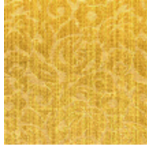
4141-06 GORDES - VIEIL OR *