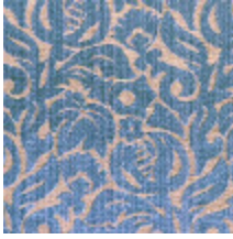
4141-02 GORDES - NATTIER *