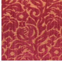
4141-01 GORDES - BORDEAUX *