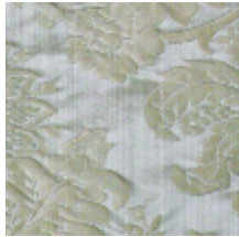
4212-10 ATHENAÏS - FUMÉE