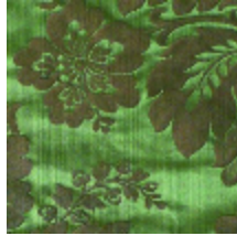
4212-04 ATHENAÏS - ACANTHE