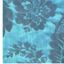
4212-07 ATHENAÏS - MESANGE