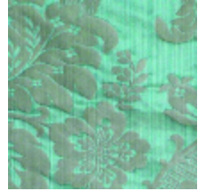
4212-08 ATHENAÏS - CELADON