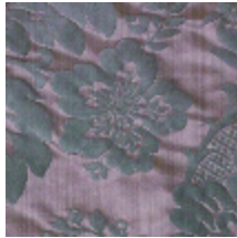
4212-11 ATHENAÏS - TAUPE *