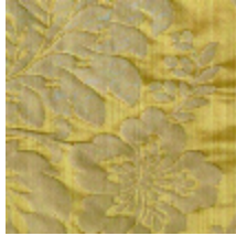
4212-02 ATHENAÏS - OR