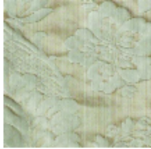
4212-01 ATHENAÏS - CHAMPAGNE