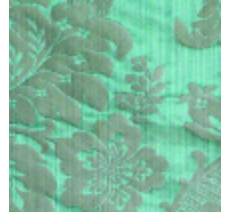
4212-08 ATHENAÏS - CELADON