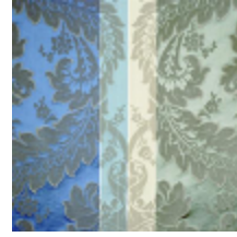
4214-06 LANCELOT - NEPTUNE *