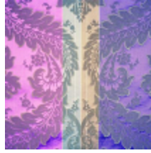
4214-04 LANCELOT - AZALEE *