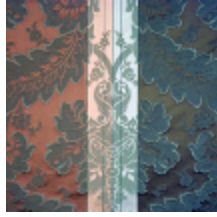
4214-03 LANCELOT - OMBRE *