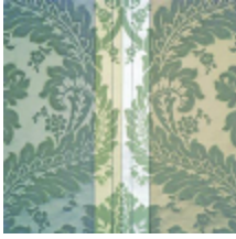
4214-02 LANCELOT - ARGENT *