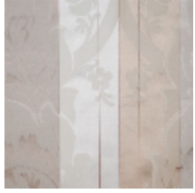
4214-01 LANCELOT - IVOIRE *