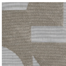
4223-03 STABLE - PIERRE *