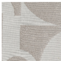
4223-02 STABILE - GALET *