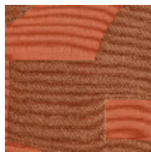
4223-04 STABILE - CUIVRE *