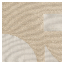
4223-01 STABILE - IVOIRE *