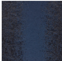
4225-03 PALAZZO - NUIT *