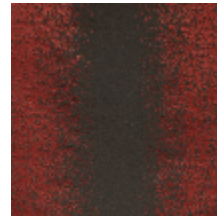
4225-05 PALAZZO - CUIVRE *