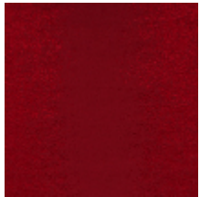
4225-01 PALAZZO - ECARLATE *