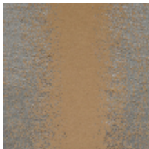
4225-08 PALAZZO - PLATINE *