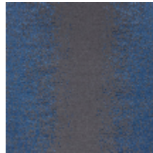
4225-04 PALAZZO - NEPTUNE *