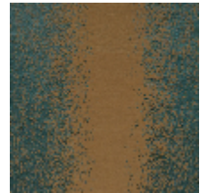
4225-06 PALAZZO - PAGODE *