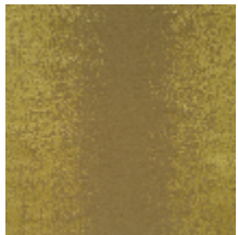
4225-07 PALAZZO - OR *