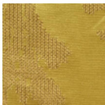
4226-03 ASUKA - OR *