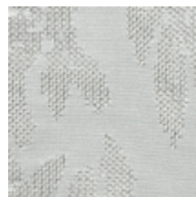
4226-07 ASUKA - CRAIE *