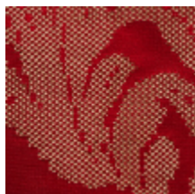
4226-01 ASUKA - ECARLATE *