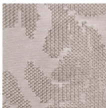
4226-05 ASUKA - EMAIL *