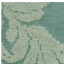
4226-04 ASUKA - JADE *