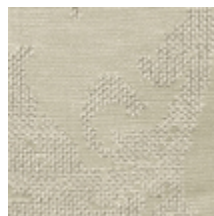
4226-06 ASUKA - NACRE *