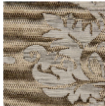
4234-04 BLASON - VERMEIL