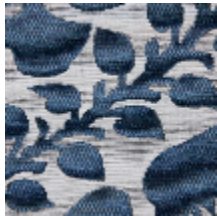
4234-01 BLASON - PRUSSE