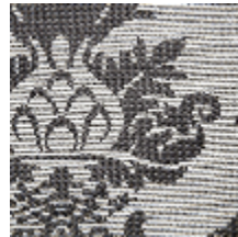
4234-05 BLASON - CENDRE