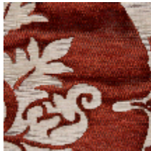
4234-02 BLASON - CORNALINE