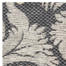
4235-05 VIGNES - LUNE *