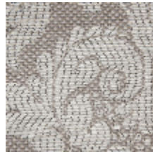
4235-03 VIGNES - PERLE