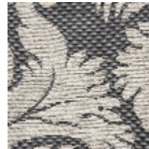
4235-05 VIGNES - LUNE