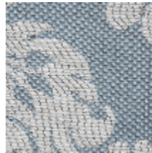
4235-04 VIGNES - CELESTE