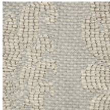
4235-02 VIGNES - EMAIL