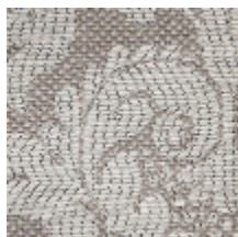
4235-03 VIGNES - PERLE