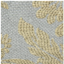
4235-01 VIGNES - AURORE