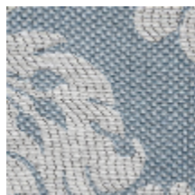
4235-04 VIGNES - CELESTE