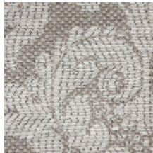
4235-03 VIGNES - PERLE