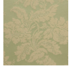
4237-06 VILLARCEAUX - AMANDE