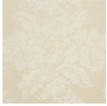
4237-01 VILLARCEAUX - IVOIRE