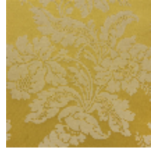
4237-05 VILLARCEAUX - OR