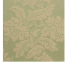
4237-06 VILLARCEAUX - AMANDE