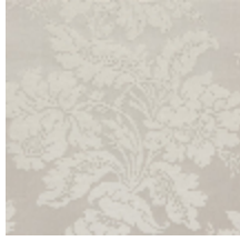
4237-02 VILLARCEAUX - ARGENT