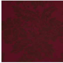
4237-08 VILLARCEAUX - RUBIS