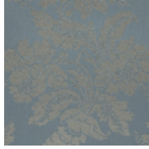
4237-03 VILLARCEAUX - POMPADOUR