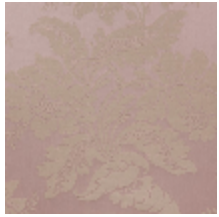
4237-07 VILLARCEAUX - POUDRE