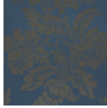
4237-04 VILLARCEAUX - NUIT