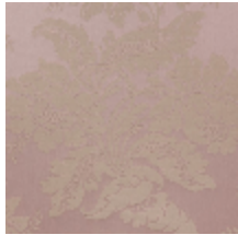
4237-07 VILLARCEAUX - POUDRE