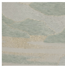
4238-03 CALANQUES - CELADON