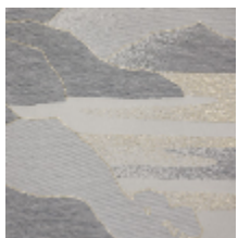
4238-01 CALANQUES - BRUME