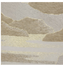
4238-02 CALANQUES - SABLE