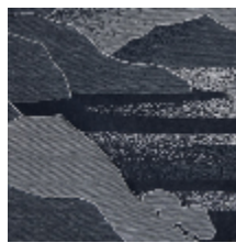
4238-04 CALANQUES - NUIT