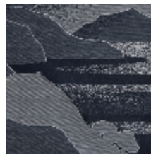
4238-04 CALANQUES - NUIT