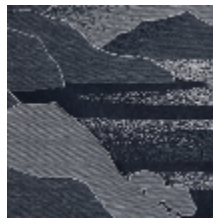
4238-04 CALANQUES - NUIT