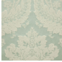
4240-01 VICTORIA - CELADON