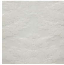
4240-09 VICTORIA - IVOIRE