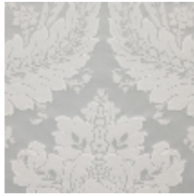
4240-08 VICTORIA - ARGENT