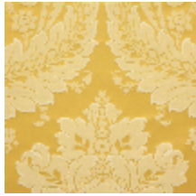
4240-07 VICTORIA - OR