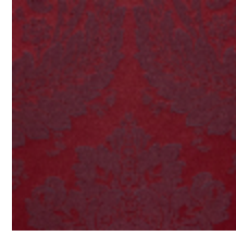
4240-05 VICTORIA - RUBIS