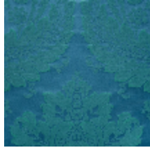
4240-03 VICTORIA M1 - CANARD