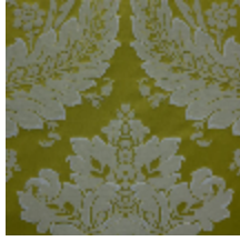
4240-02 VICTORIA M1 - OLIVE