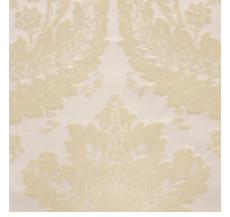
4240-06 VICTORIA - POUDRE