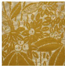
4241-03 VETIVER M1 - BERGAMOTE