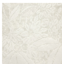
4241-04 VETIVER - JASMIN