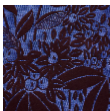
4241-01 VETIVER - IRIS