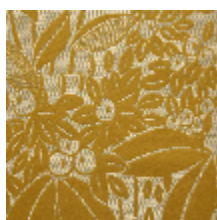
4241-03 VETIVER - BERGAMOTE