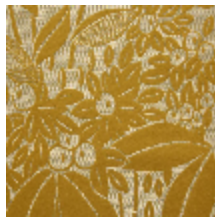
4241-03 VETIVER M1 - BERGAMOTE