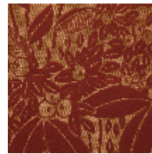
4241-05 VETIVER M1 - EPICE