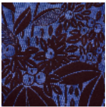
4241-01 VETIVER M1 - IRIS