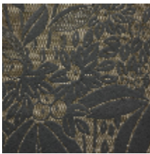
4241-02 VETIVER M1 - ENCENS