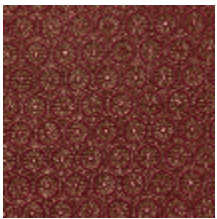
4243-01 MEDAILLON - CRAMOISI