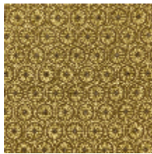
4243-03 MEDAILLON - MORDORE