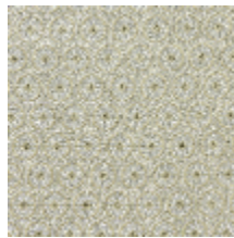
4243-04 MEDAILLON - VERMEIL