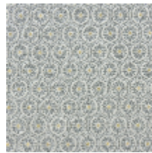
4243-05 MEDAILLON - EMAIL