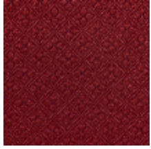
4244-01 BOSQUET - CRAMOISI