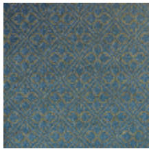
4244-07 BOSQUET - PRUSSE