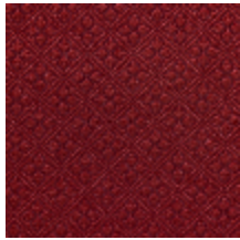
4244-01 BOSQUET - CRAMOISI