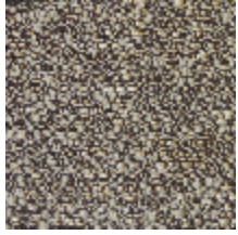
4246-01 ORÉE - LIEGE