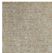
4246-05 ORÉE - GRES