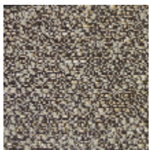
4246-01 ORÉE - LIEGE