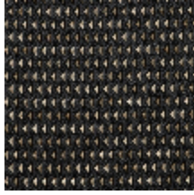
4248-02 DIAMANT M1 - ONYX