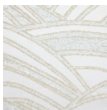
4250-03 DUOMO - NACRE