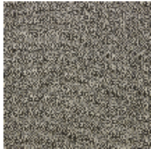
4251-07 KATMANDOU - LIEGE