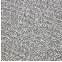
4251-01 KATMANDOU - GRANIT