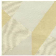
4252-03 DALAI - NATUREL