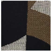
4252-01 DALAI - ECAILLE