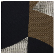
4252-01 DALAI - ECAILLE