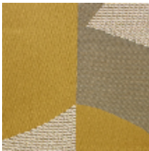
4252-02 DALAI - SOLEIL