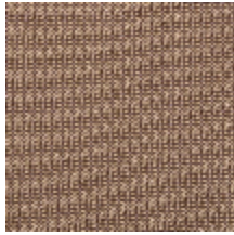
4257-08 PLATINE M1 - BRONZE