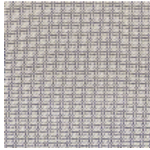
4257-09 PLATINE M1 - PALLADIUM