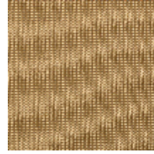
4257-05 PLATINE M1 - DORE