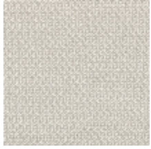
4257-01 PLATINE M1 - TITANE