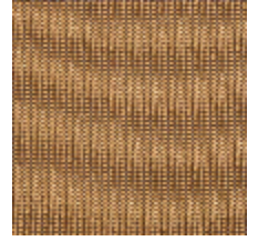
4257-06 PLATINE M1 - MORDORE