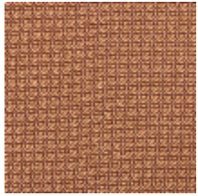
4257-07 PLATINE M1 - CUIVRE