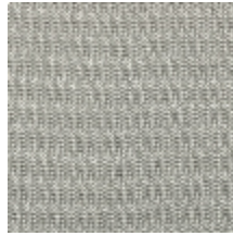
4257-10 PLATINE M1 - ZINC