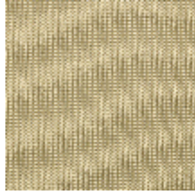
4257-03 PLATINE M1 - VERMEIL