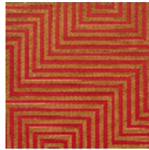
4258-04 HERA M1 - PAVOT