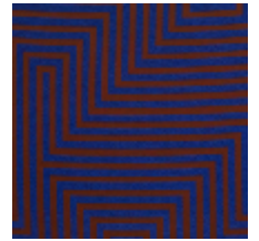
4258-06 HERA M1 - LAPIS