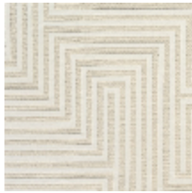
4258-02 HERA M1 - NATUREL