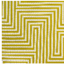
4258-03 HERA M1 - ABSINTHE