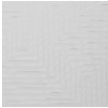
4258-01 HERA M1 - BLANC