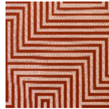
4258-05 HERA M1 - BOIS DE ROSE