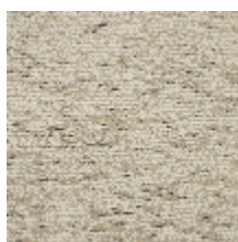
4259-03 BALTIC - SABLE