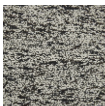
4259-01 BALTIC - POIVRE