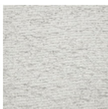
4259-02 BALTIC - FUMÉE