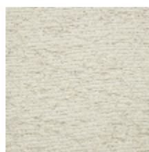
4259-04 BALTIC - ECRU