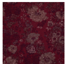
4261-06 FELICITÉ - GRIOTTE