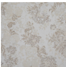
4261-02 FELICITÉ - NACRE