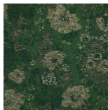
4261-04 FELICITÉ - BUIS