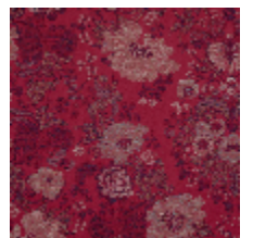
4261-06 FELICITÉ - GRIOTTE