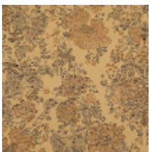
4261-01 FELICITÉ - DORÉ