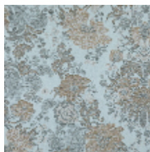
4261-03 FELICITÉ - NATTIER