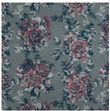
4263-01 RONSARD - POMPADOUR