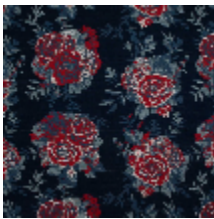
4263-02 RONSARD - ENCRE