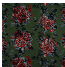
4263-03 RONSARD - PRAIRIE