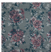
4263-01 RONSARD - POMPADOUR