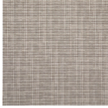
4265-02 CAMBREMER - BEIGE