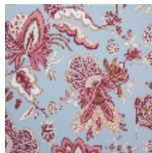
4266-04 EGLANTINE - BOUDOIR