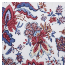
4266-03 EGLANTINE - GRIOTTE