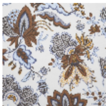
4266-01 EGLANTINE - NATUREL