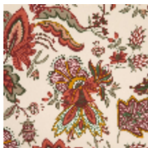
4266-02 EGLANTINE - PRINTEMPS